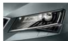
Smart Light Assist - automatické přepínání a clonění dálkových světel