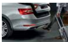
Virtuální pedál - bezdotykové otevírání 5. dveří