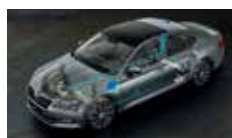
Adaptivní podvozek - volitelné nastavení podvozku ve 3 režimech (Comfort, Normal, Sport)

ŠKODA usnadňuje život svým zákazníkům každý den.