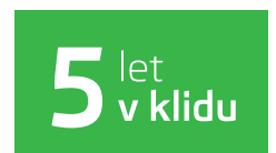
Předplacený servis na 5 let / 100 000 km při financování od ŠKODA Finance